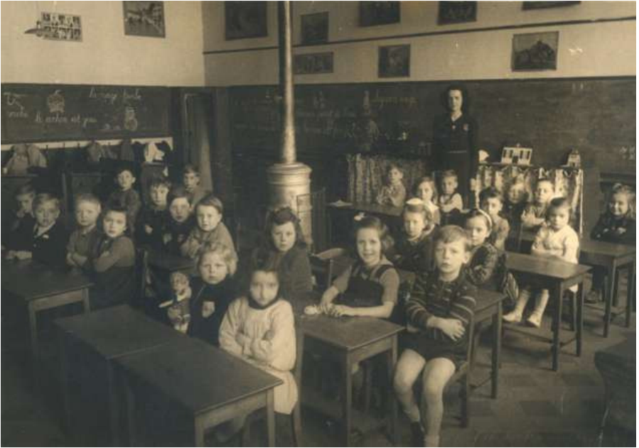
Des classes Place Merlot